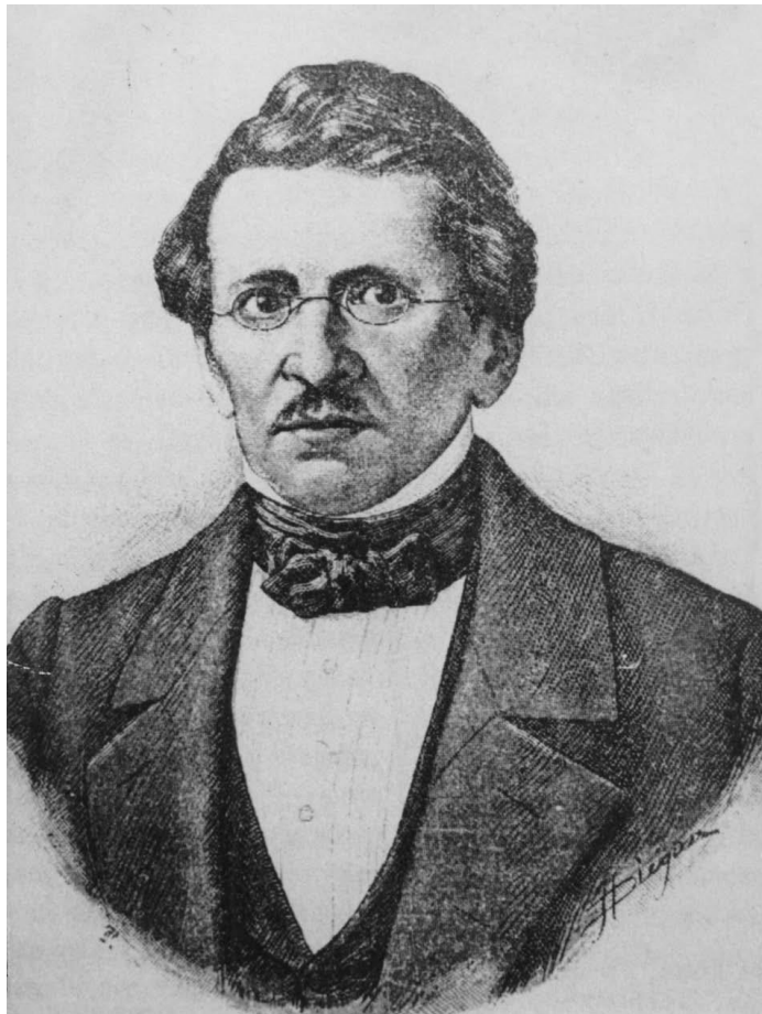
JUSTO SIERRA O' REILLY