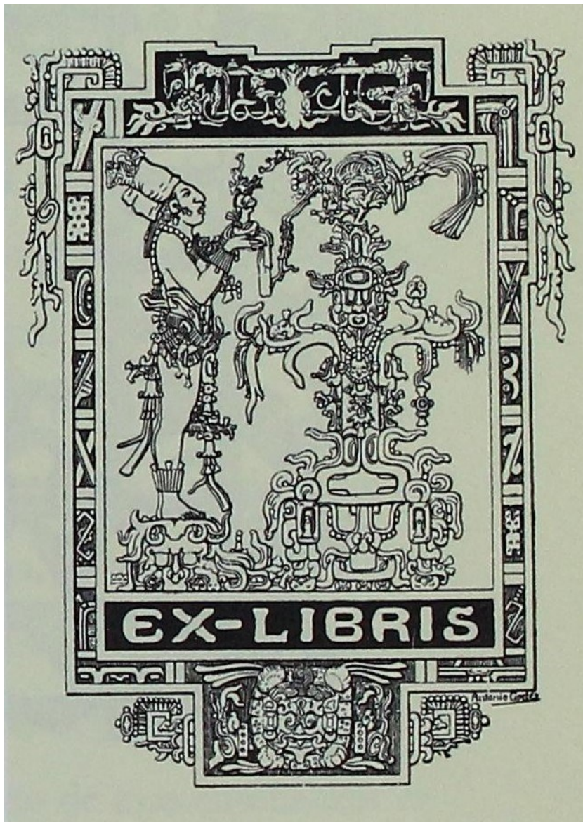
Imágenes tomadas de: Hernández López, Selva y López Casillas, Mercurio. Ex-libris mexicanos. Artistas del siglo XX. México : Editorial RM, 2001.